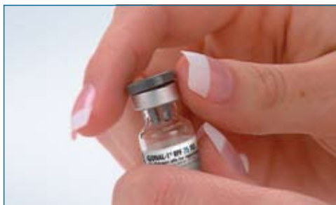
1. Flip the protective plastic cap off of the Gonal-f ® RFF vial.