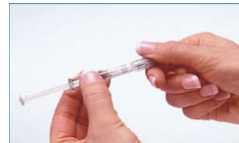
3. Hold the barrel of the prefilled syringe of Sterile Water in one hand. Carefully twist off the protective cap of the prefilled syringe.