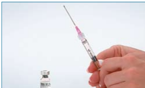
8. Gently pull the plunger back to allow a small air space. Recap the needle. Twist off the mixing needle from the syringe and discard in your safety container.