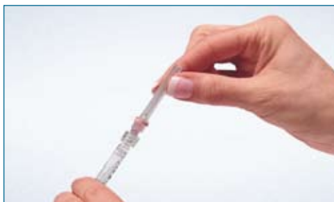
4. Remove the safety seal cover of the 18 G 1 1/2" pink needle. Twist the needle onto the prefilled syringe until it is tightened, being careful to keep the protective needle cap in place. Remove the protective needle cap.