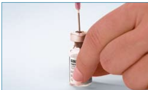
5. With the vial of Gonal-f ® RFF powder on a flat surface, insert the needle of the prefilled syringe straight down through the marked center circle of the rubber stopper. Slowly inject the water by pushing down on the plunger. DO NOT shake.