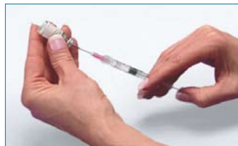
6. Invert the vial and pull back the 18 G 1 1/2" needle as far as needed, and withdraw the entire contents of the vial. Remove the syringe from the vial.