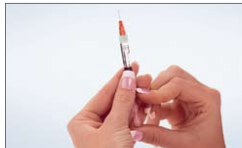
10. With the syringe pointing upward, gently tap on the syringe and slowly push the plunger until all air bubbles are gone and a drop of liquid appears on the tip of the needle.