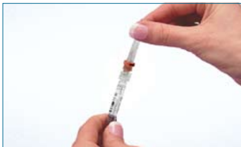
9. Remove the safety seal cover from the 29 G 1/2" red needle. Twist the needle on the prefilled syringe until it is tightened, being careful to keep the protective cap in place. Carefully remove the protective needle cap.