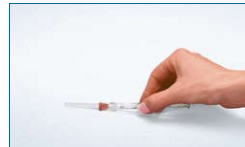
11. Recap the needle. The administration syringe is now filled with the prescribed dose of Gonal-f ® RFF and is ready for administration.

Use reconstituted Gonal-f ® RFF 75 IU vial immediately.